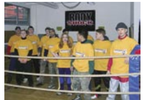
Die Military-PT-Truppe vor dem Start... Fotos: Body-Shock und Ich-will-keine-Schokolade

Das Schokoteam kämpft für euch an vorderster Fitness-Front gegen Faulheit, Langeweile und überschüssige Pfunde