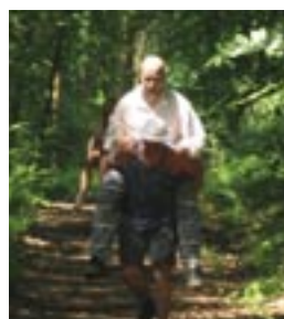
Huckepack ...sieht der Wald gleich schöner aus!

Nachdem wir ein gutes Stück in den Schiffenberger Wald hinter dem Phil II gelaufen waren, kam die erste „Spezial-Übung“: Je zwei Leute bilden mit ihren Armen einen Sitz für den glücklichen Dritten, der sich dort hineinsetzen und tragen lassen