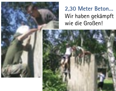
2,30 Meter Beton... Wir haben gekämpft wie die Großen!

Als letztes Hindernis stand auf dem Unigelände noch eine ca. 2,30m hohe Betonwand zwischen uns und dem Ziel, dem Body-Shock-Hauptquartier, in dem die Duschen warten! Diese Mauer galt es zu überwinden. Und das war nicht grade die einfachste Sache der